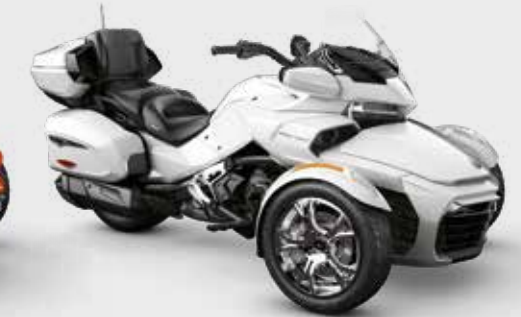
PEARL WHITE* Chrome Edition