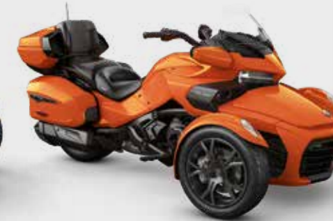
PHOENIX ORANGE METALLIC* Dark Edition