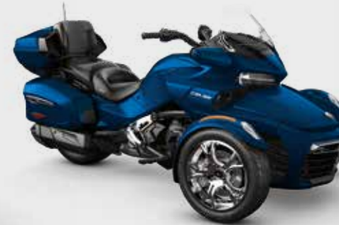
OXFORD BLUE METALLIC* Chrome Edition