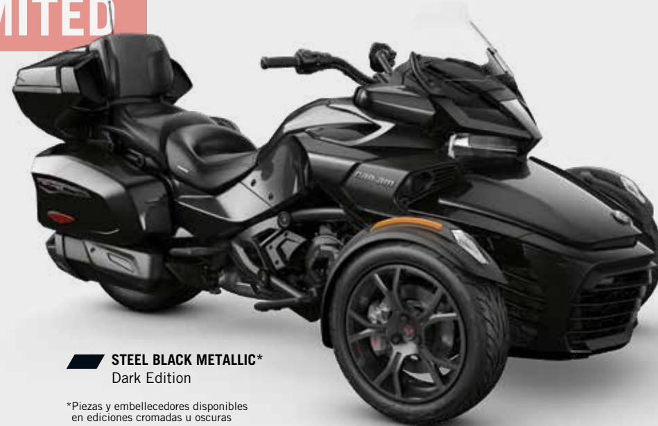
STEEL BLACK METALLIC* Dark Edition

*Piezas y embellecedores disponibles en ediciones cromadas u oscuras